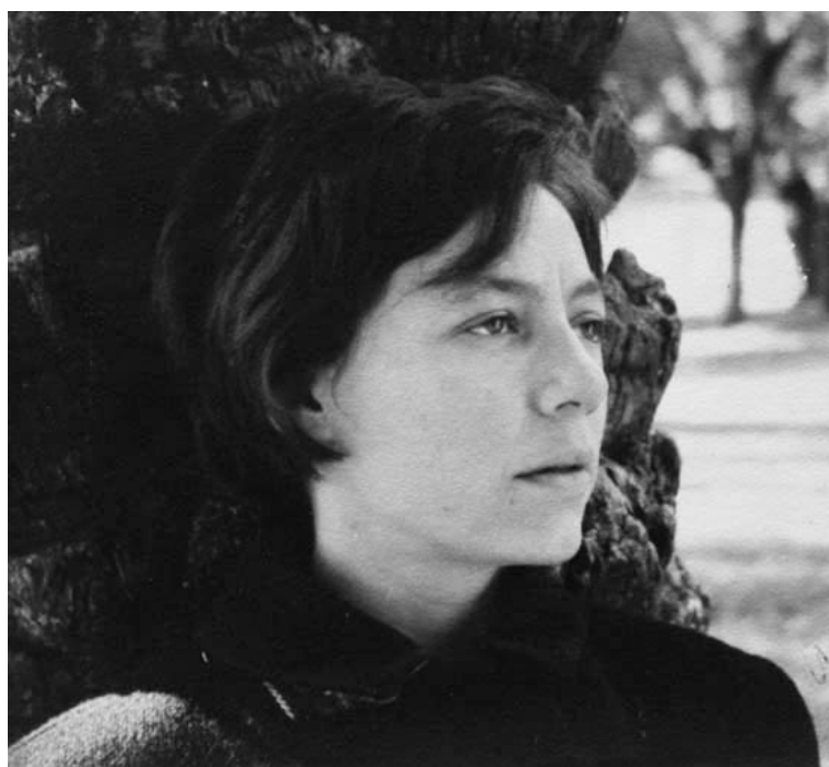
Alejandra Pizarnik en Buenos Aires, 1967.